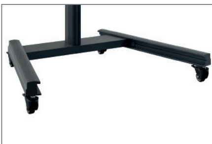
Lenkrollen mit Feststellbremse