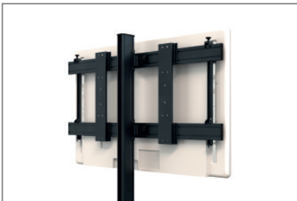
Rückseitige Kabelführung entlang der Rails