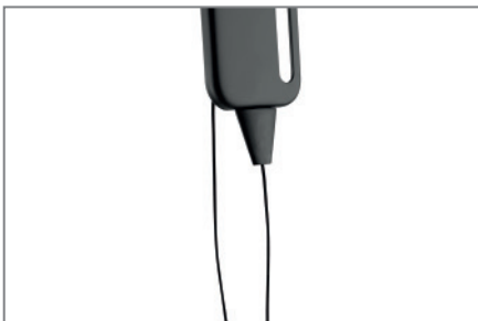
Lösevorrichtung mit Magneten unsichtbar an der Halterung arretierbar