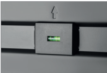
integrierte Wasserwaage für eine präzise Ausrichtung des Bildschirms